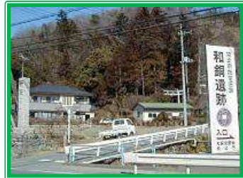
和銅遺跡は約1300年前