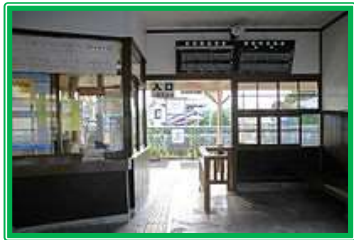
大正3年開業の和銅黒谷駅(車で9分)