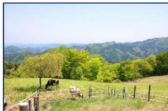
彩の国ふれあい牧場