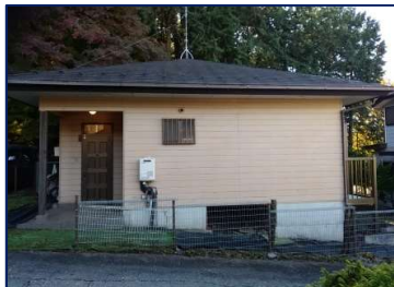
外観・平成29年11月撮影