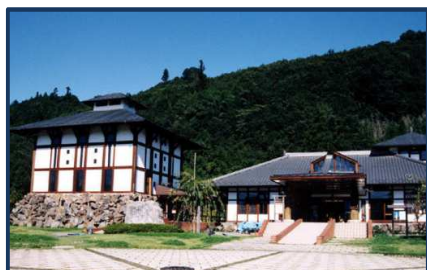
道の駅龍勢・龍勢会館(約1.7km)