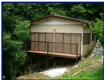
外観(平成29年7月撮影)