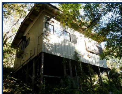
大久保沢からの外観