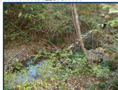
南西脇を流れる大久保沢