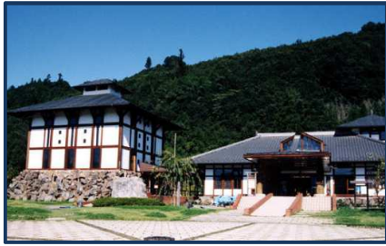
道の駅龍勢・龍勢会館(約1.7km) ※現況有姿でのお引き渡しとなります