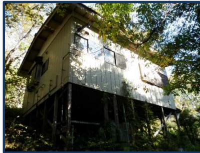
大久保沢からの外観