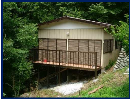
外観(平成29年7月撮影)