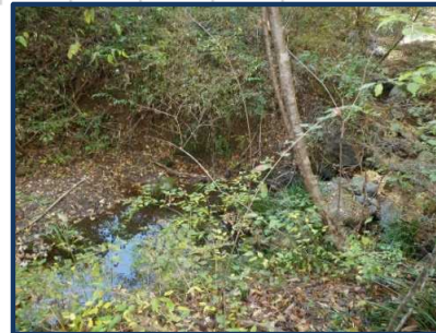
南西脇を流れる大久保沢

【価格改定】新価格 100万円 価格改定日 2022年12月14日(旧価格 150万円 旧価格公表日 2021年6月14日)